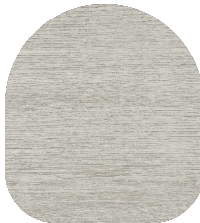
Detall de paviment TIPUS gres.

Fals sostre continu de cartró guix en vestíbuls, passadissos, cuines i banys, llevat d'on calgui algun registre, acabat amb pintura plàstica.