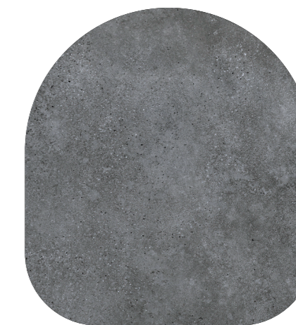
Detall de paviment TIPUS gres.