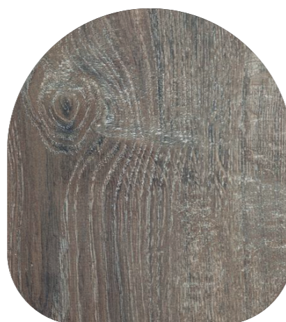
Detall paviment TIPUS parquet laminat roure de 8 mm.

Sostres acabats amb pintura plàstica llisa de color clar.